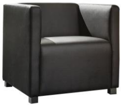
Sessel mit Blocksitz