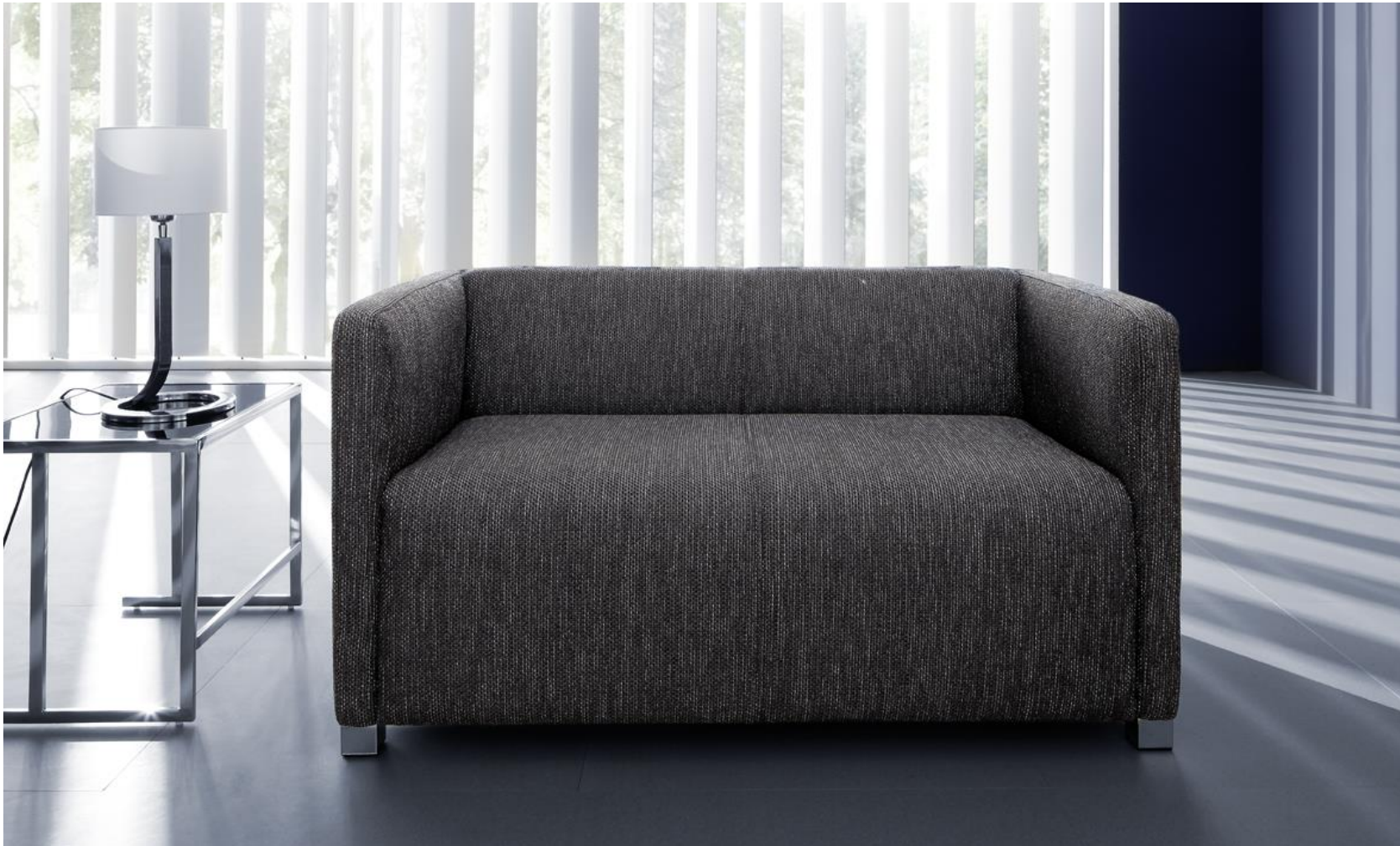
2-Sitzer mit Blocksitz